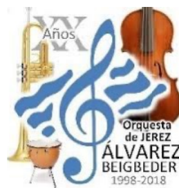
Orquesta Álvarez Beigbeder