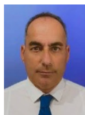
Marcos Serna Diseño de iluminación