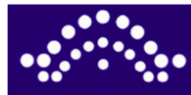
Coro del Teatro Villamarta